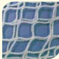
4 cm Maschenweite

Wenn die Maschen zu groß sind (wie es traditionelle Heunetze sind), bekommt das Pferd vielleicht zu viel Heu zu leicht ins Maul und kaut daher nicht ausreichend durch. Dies stellt das Pferd nicht zufrieden und es frisst zu viel.